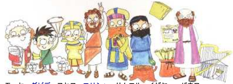
モーセ ダビデ ヨセフ エリシャ サムエル イザヤ パウロ