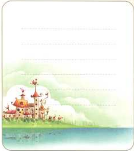
クイズ おもしろいクイズあそび