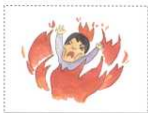
五番目 壁 死んで地獄に