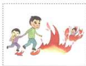
六番目 わな 子どもに この問題が続く