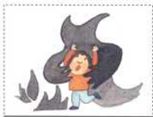
一番目 運命 悪魔の子

ところが、問題が起きてしまった！ サタン（悪魔）にだまされて、人間が神様をはなれて しまったの。また罪をおかして、のろわれて、ほろびるようになったの！ その時から人間は六つの問題 があるようになったの。