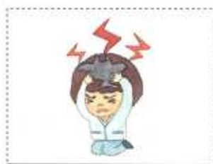
三番目 障害物 精神が病気に