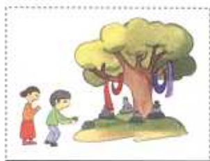
二番目 わな 偶像崇拜