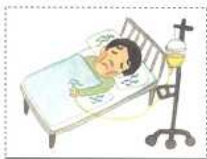
四番目 障害物 肉体が病気に