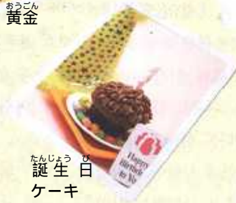
たんじょう 白 ケーキ