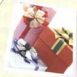
プレゼントのつつみ