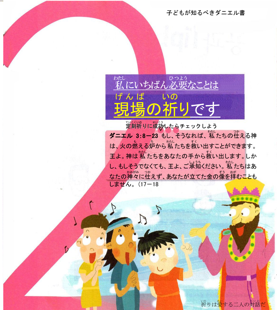
いの祈りは愛する二人の対話だ

定刻祈りに成功したらチェックしよう ダニエル 3:8-23 もし、そうなれば、私たちの仕える神は、火の燃える炉から私たちを救い出すことができます。王よ。神は私たちをあなたの手から救い出します。しかし、もしそうでなくても、王よ、ご承知ください。私たちはあなたの神々に仕えず、あなたが立てた金の像を拝むこともしません。(17-18)