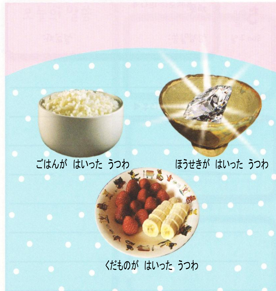
ごはんがはいったうつわ