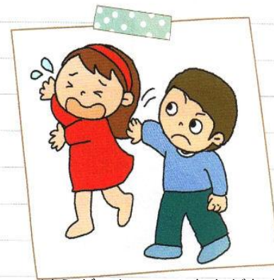
はらが たって ともだちを たたきました