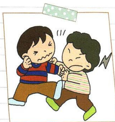
ともだちと なぐりあいの けんかを しました

えの ような ことを したことは ありますか。 こんなとき どうすればよいのか えを みて はなしあって みましょう。