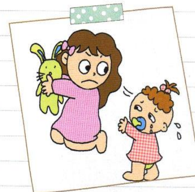
いもうとの おもちゃを とりました