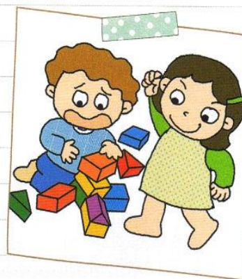
ともだちの おもちゃを こわしました。