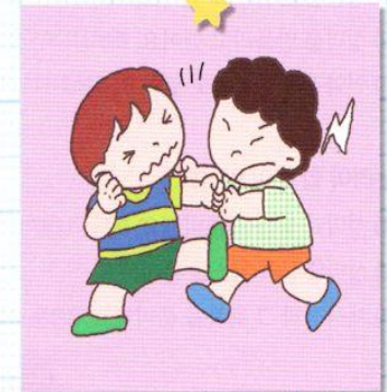
ともだちと けんかをします