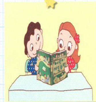
ともだちと いっしょに みことばを よみます