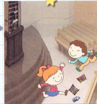
れいはいどうで はしりまわります