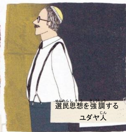
選民思想を強調する ユダヤ人