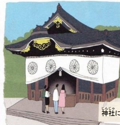
神社におまいりする人