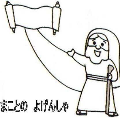
まことの よげんしゃ