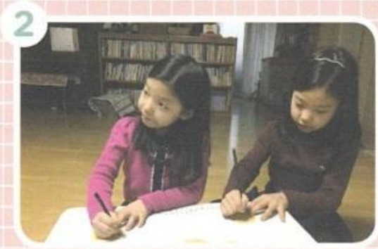
2 かみさまの ころを かなしませる ことを かんがえて はなして かくか えを かきましよう。 つぎのページに ある えを きりとって つかっても よいです。