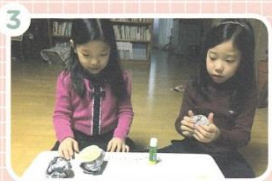
3 しんぶんしを まるめた ボールに きりとった えを はりましよう