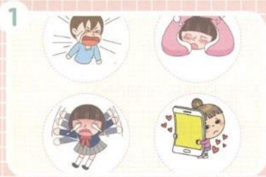
1 つぎのページの えと じゅんぴするものを そろえます