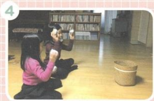
4 かみさまの ころを かなしませる ことを はった しんぶんしの ボールを ゴミばこに なげて にどとしないようにと いのり ましよう。