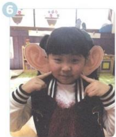
みみを ピンと たてて かみさまの みことばに しゅうちゅうしましょう