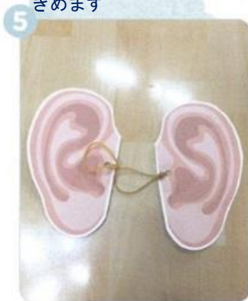
あなに わゴムを とおします