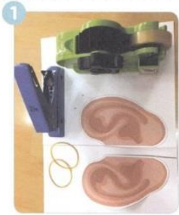
じゅんぴするものを そろえます