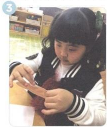
あなが やぶれないように セロテープを はります