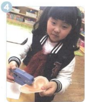
セロテープを はった がわに パンチで あなを あけます