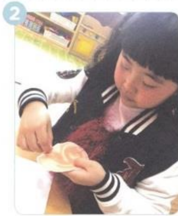
みみを きりぬいて うちがわの ぶぶんに あなを あける いちを きめます