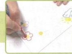
いろえんぴつや、クレヨンで 色をぬったり、いろいろな もので、封筒を飾ります