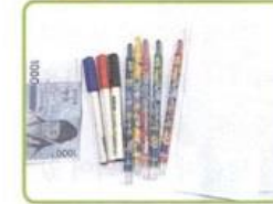
郵便に使う 手紙用の封筒を準備します。