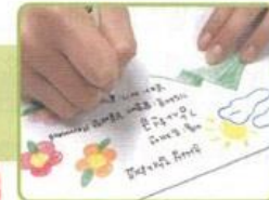
封筒の片面に なまえ、献金の種類、 祈りの課題と日付を書きます