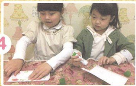
のりを つけた あと くっつけます