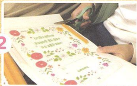
つぎの ページの えを きりぬきます