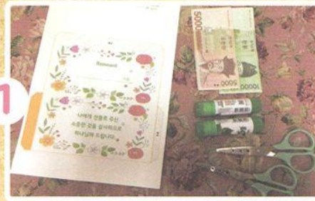
じゅんびするものを そろえます