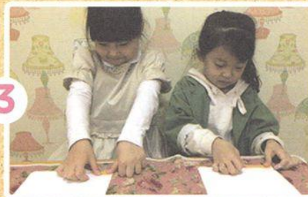
てんせんに そって おります