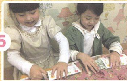
かみさまに じゅんびした ささげものを いれます