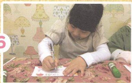
そのあと わたしの なまえを かきます