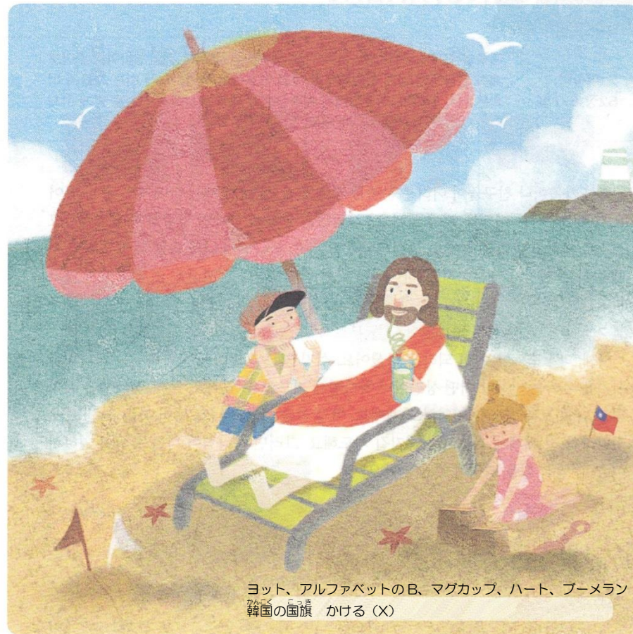
ヨット、アルファベットのB、マグカップ、ハート、プーメラン 韓国の国旗 かける(X)

福音であるイエス・キリストに出会って神の子どもになった私は、ほんとうに幸せな存在です。下の絵にも福音を持って、とても幸せな友だちがいます。絵を見て、隠れている絵を探しましょう。全部で7つあります。