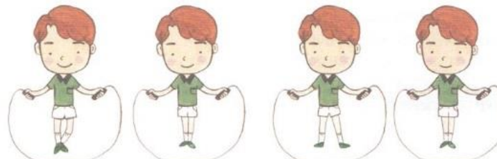
②じゃんけん飛び 前とうしろに一回ずつかわるがわる足をひろげて、横に開いて一回、足を合わせて一回～