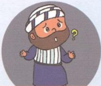
うたがいぶかい トマス