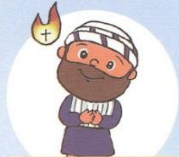
まことの しんこうの かいふく