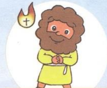
いわの うへの きょうかい