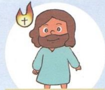
ゆうかなな じゅんきょうしゃ