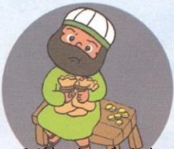
つみびと しゅぜいにん マタイ