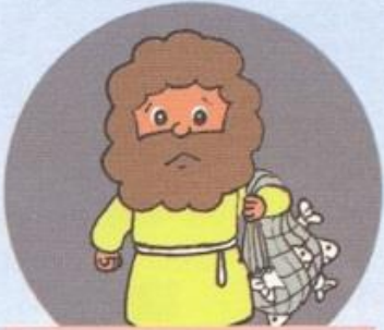
りょうしだった ペテロ