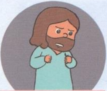
よくおこっていた ヤコブ