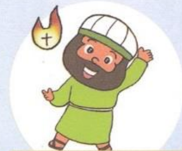
イエスさまが いちばん すき