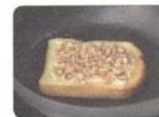
その上にクランベリー ブルーベリーなどを おいて、もう一枚、 食パンを上からおきます