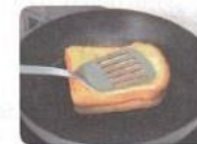
フライパンの弱火で 30秒ほど焼きます