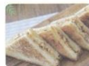
集中力を高めるトーストが できあがりました！ パパとママ、ともだち、 家族といっしょにわけて 食べましょう