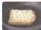
食パンの上に モッツアレラチーズを おきます

準備するもの：食パン、モッツアレラチーズ、クランベリーやブルーベリーなどの果実 *トーストを作りながら、霊的力を受けるみことばをひとつ覚えよう