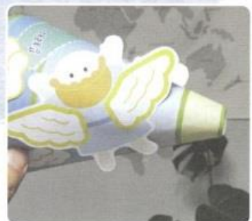
6. もういちど こられる イエスさまの ラッパが できました～