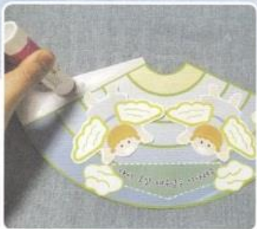
4. てきとうな ところに きりぬいた えを はります