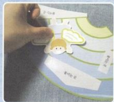
3. てんしの かたちを はります