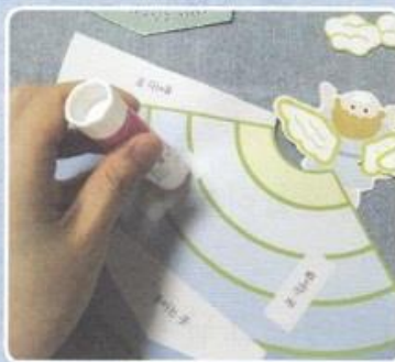
2. のりを つける ぶぶん に のり を つけます