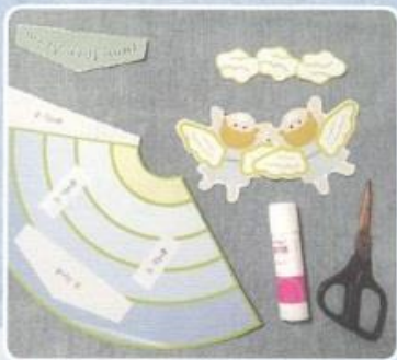
1. つぎと そのつぎの ページの えを きりぬきます