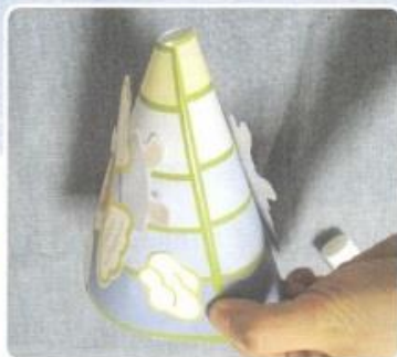
5. ラッパの かたち に しゅんのように のり をつけて つくります