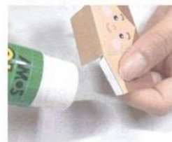
03 斜線のはいている部分にのりをつけてはりあわせませす