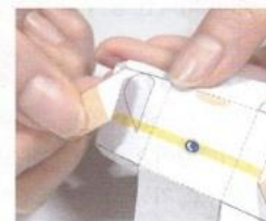
04 斜線のはいている部分にのりをつけてはりあわせませす