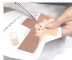
01 かたちを切り抜きます