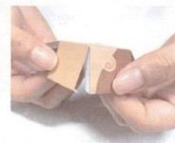
02 点線と実線をおります