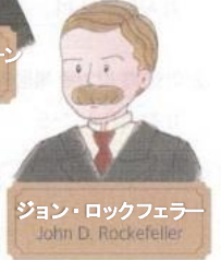
ジョン・ロックフェラー John D. Rockefeller