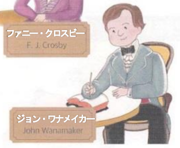
ジョン・ワナメイカー John Wanamaker