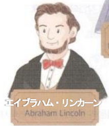
エイブラハム・リンカーン Abraham Lincoln