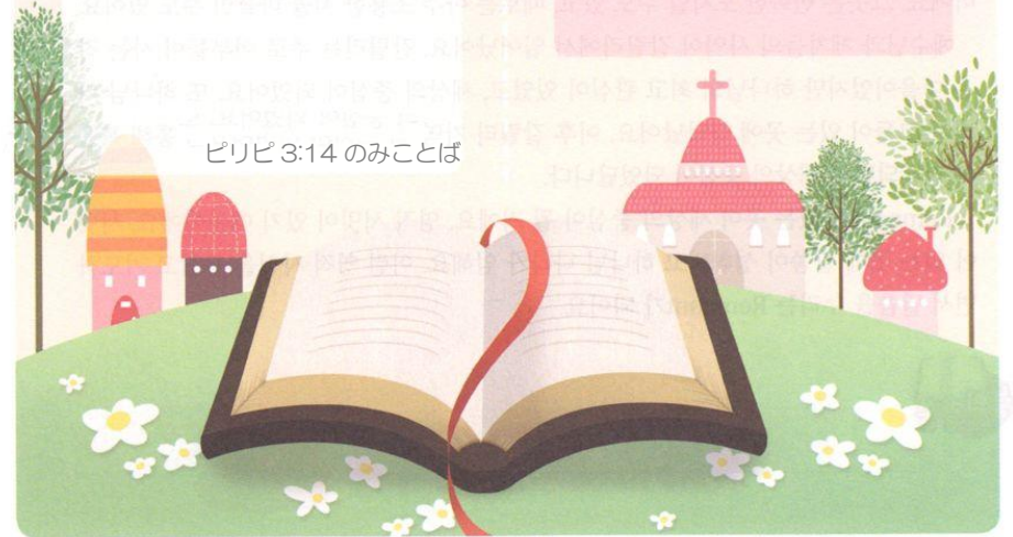
ピリピ 3:14 のみことば