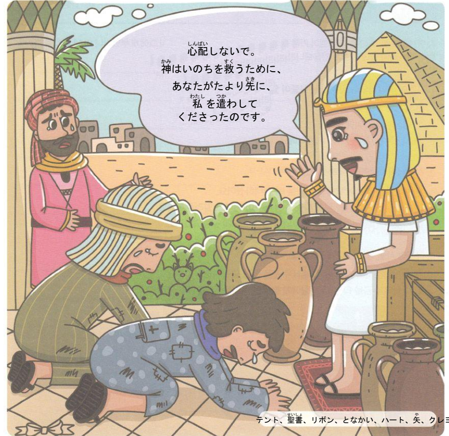
テント、聖書、リボン、となかい、ハート、矢、クレヨン

兄たちに会ったヨセフは、神様がエジプトに送ってくださったと告白しました。その告白をしている絵に隠れている絵を見つけてみことばで導かれる神様に感謝の祈りをささげましょう。