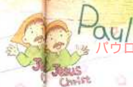
パウロ Paul Jesus Christ