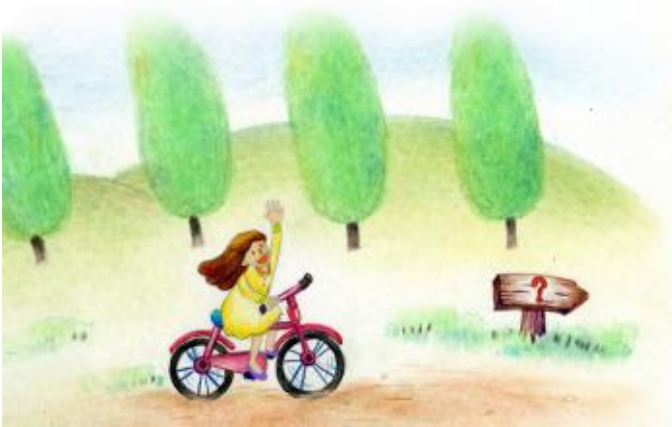
イラスト_シン・ジョンウン

普通、おばあさんたちは暮して来た人生の重さとともに多くの経験を持っている。たまに孫たちの姿を見ながら、お前の姿がどうしてそんなに父と似ているのかと言う。子どもたちは教えられていないのに、親の行動をまねる。お酒が好きなパパが嫌い、「私は絶対にお酒を飲まない」と言っていた息子がおとなになったとき、のんべえになって家庭内暴力の主人公になったり、パパに苦しめられる苦しい家庭を見て「私は絶対にママのようにはならない」と言っていた娘が、おとなになってママの苦しい生活を同じように繰り返す例を、私たちの周辺でたくさん見る。