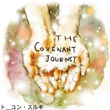
イラスト_ユン・スルギ